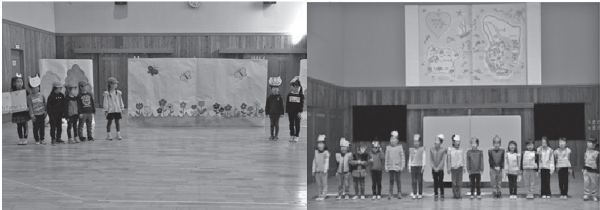
図4 劇遊びの背景制作での比較

作業の効率化、負担の軽減という観点からは情報機器の活用により大きな効果があったといえる。一方で教育効果については、時間と手間のかかる共同作業など様々な活動を通して得るものも大きいことから単純に保育活動を全て ICT 化し置き換えることはマイナスとなる面もあり、効率化で得た時間や余裕を活かすなど活用上のバランスの検討が重要である。