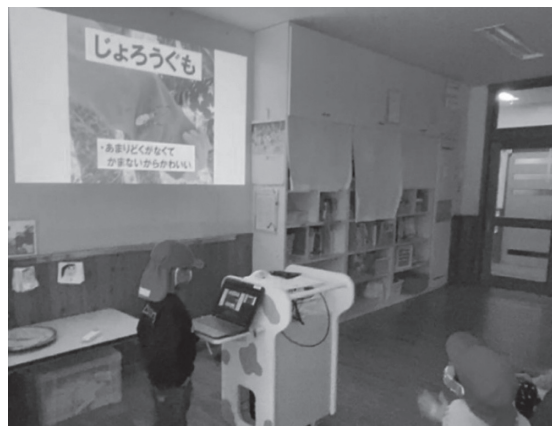
図3 写真を利用した発表

保育者の負担としては発表前に園児と対話し、伝えたいことを聞き取り、ポイントをコメントとして画像に追加する作業と時間が必要となったが、編集作業自体はスライドソフトで完結したため操作スキル修得の負担は小さいようであった。コンテンツは園児に1対1対応のため他クラス、次年度の再利用は無いと思われる。