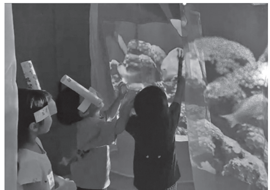
図5 不思議な海の映像に入り触る体験

さらにシュノーケル、水中眼鏡、網、釣り竿、銚などを制作し、制作物を持って本実践の海映像の中に入った。体育館に複数枚の透過性のある柔らかなスクリーンを吊るし、海の動画を投影したことで、スクリーンをくぐって映像の中に入り、スクリーンや映像を手や制作物で触れる姿が見られた。また生き物を指して友達や保育者に教える姿や、動きを真似る姿も見られた。本活動では海の中の世界観を感じ、海中で過ごすイメージを持ちながら遊ぶことができていた。このような映像空間世界への没入感を伴う演出効果は、プロジェクターの投影ならではの効果と思われる。なお今回の活動のようにスクリーンに映像をプロジェクターから投影し空間内で視覚、触覚、聴覚などを通じた感覚を体験する活動としては、エプソンが提案する「ゆめ水族園」 11) がある。本活動はエプソンの「ゆめ水族園」を保育者が見学し、園内でより簡易に実践する方法について検討し行ったものである。